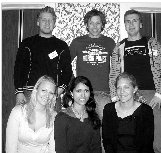
Helt Halling: Et glisende norsk vinnerlag etter finaleseier over svenskene i motemesterskapet i hallingdans. - Vi har jo ingen Hallingdal, hevder svenskene i et protestbrev.

Alt i alt var dette en både lærerik og fornøylig opplevelse! Til neste år setter vi kursen mot Napoli, vi gleder oss!