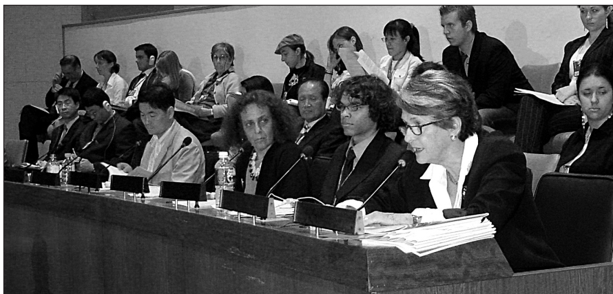
Dr. Helen Caldicott om medisinske effekter av atomenergi, under en NGO-presentasjon på tilsynskonferansen i New York.

Norge var, som ved tidligere Tilsynskonferanser, med på forslagene fra G10 (Australia, Østerrike, Canada, Danmark, Ungarn, Irland, Nederland, New Zealand, Norge og Sverige). G10 ble mer markert i år, antagelig fordi New Agenda Coalition slet med intern uenighet, men mesteparten av forslagene gikk på ikke-spredning og fredelig bruk av atomteknologi. Forslagene var ikke kontroversielle og hensikten var å foreslå tekst som kunne danne grunnlag