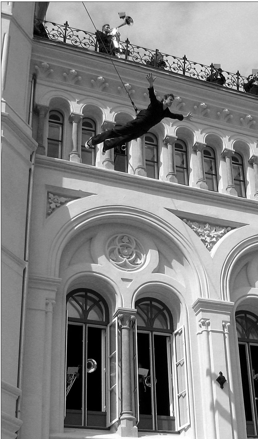
Flott beliggenhet i den gamle Vestbanebygningen. Musikere på taket og akrobater fra Sirkus Sapiens krydret åpningssermonien.