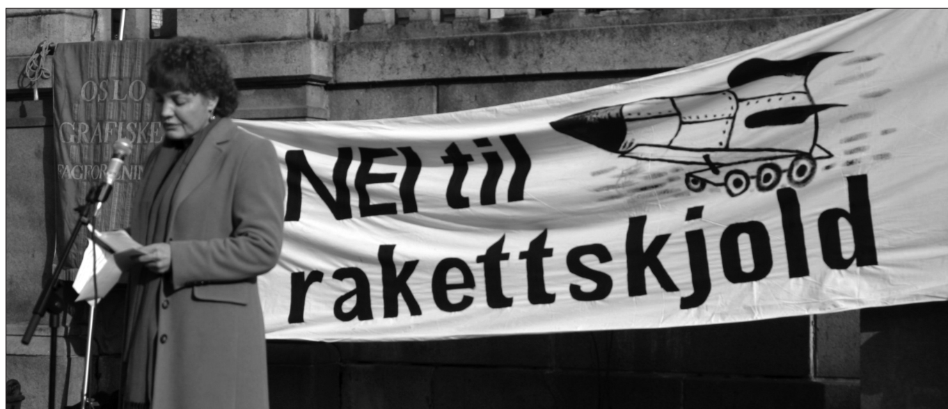
Marit Nybakk holder appell under markeringen mot rakettskjoldet