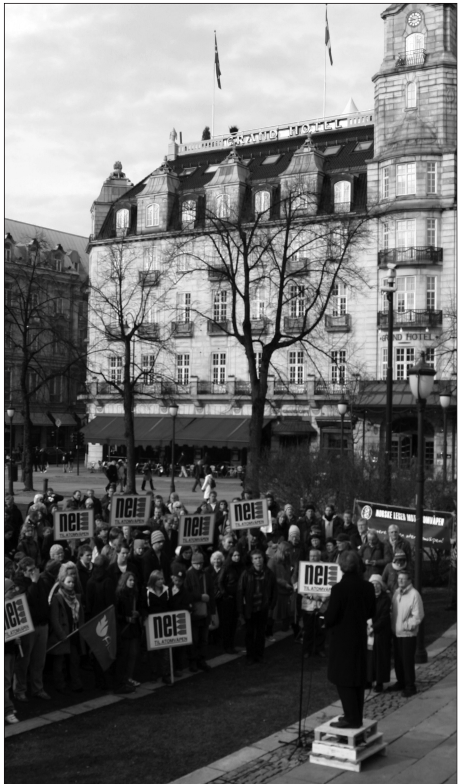
Demonstrasjon mot det et framtidig NATO rakettskjold utenfor Stortinget 1. april

Video fra markeringen kan sees på: http://folk.uio.no/espenp/topp/film.html