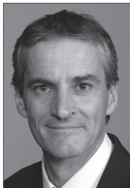
Støre vet ikke hva han vil gjøre.

Vårt viktigste bidrag før NATO-toppmøte i april, var ifølge Støre å bruke våre internasjonale nettverk til å skape bevissthet om skjoldet og mobilisere den folkelige motstanden i andre NATO-land. Tiden er knapp, så dette arbeidet må startes opp umiddelbart.