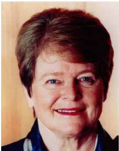
Gro Harlem Brundtland.

I appellen 'Fjern alle atomvåpen', publisert i Aftenposten 3. juni 2009, gjør fire tidligere statsministere, Odvar Nordli (Ap), Gro Harlem Brundtland (Ap), Kåre Willoch (H), Kjell Magne Bondevik (KrF), og én tidligere utenriksminister, Thorvald Stoltenberg (Ap), felles