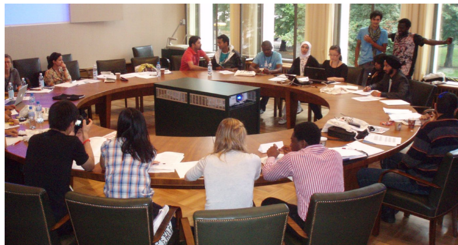
Student International Council Meeting - det første gjennomførte møtet på en verdenskongress med internasjonale, regionale og nasjonale studentrepresentanter.

Dagen ble avsluttet med middag og konsert med Basel symfoniorkester.