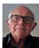
PER WIUM RÅDSMEDLEM NORSKE LEGER MOT ATOMVÅPEN