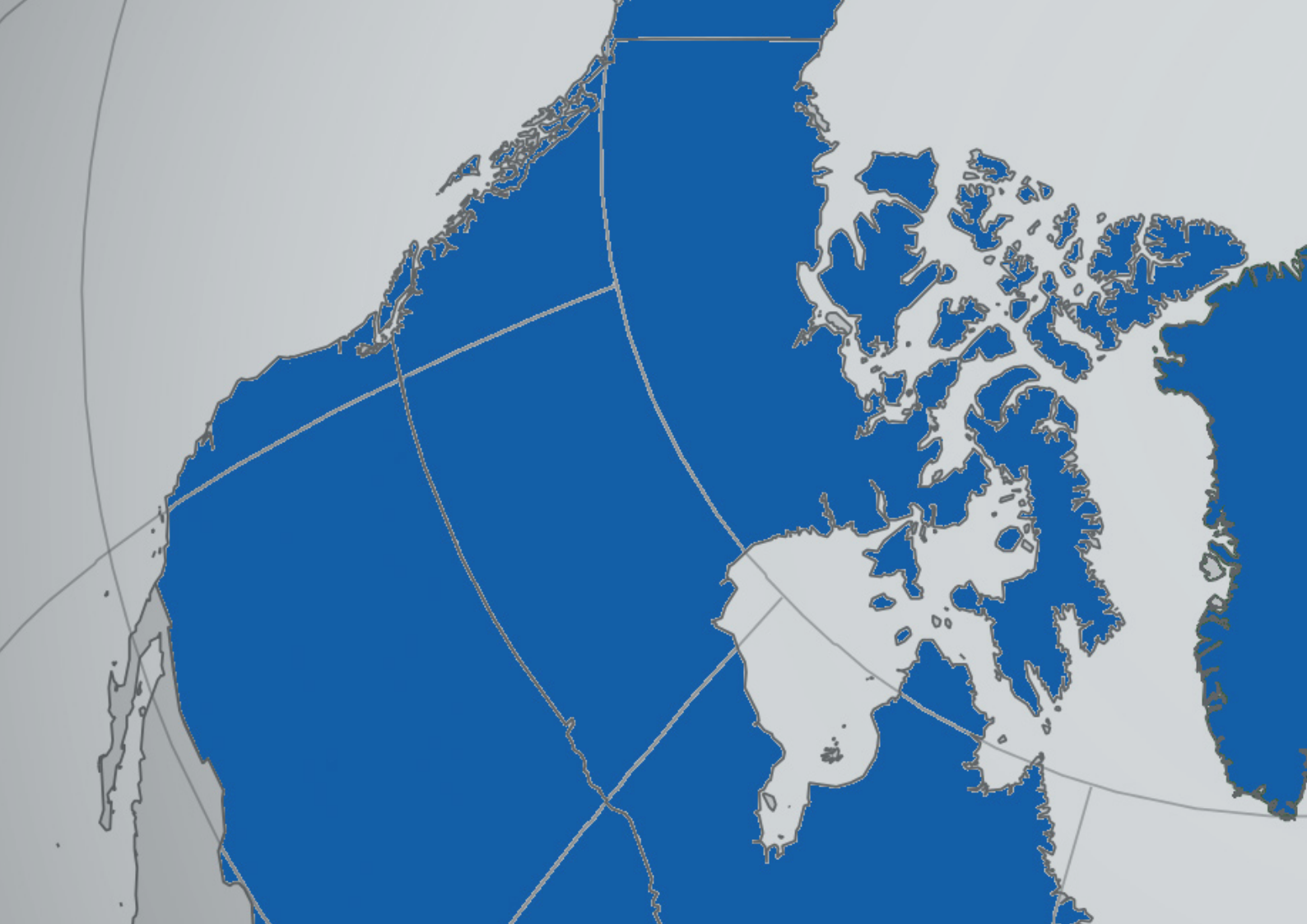
Nato og Warszawapakten under Den kalde krigen (Wikimedia commons)

alliansen å stå imot amerikanernes ønske om en tydeligere rolle for atomvåpnene. I november 1954 vedtok Natos råd for første gang et militært planleggingsdokument som eksplisitt åpnet for bruk av atomvåpen. Dokumentet ble vedtatt uten debatt og etter stort press fra Eisenhower-administrasjonen i USA, som angivelig var bekymret for at atomvåpen var i ferd med å bli ansett som umoralske, ubrukelige og dermed verdiløse. 12 Dokumentet slo fast at dersom Sovjetunionen gikk til angrep, ville «Nato», dvs. USA og eventuelt Storbritannia, som hadde testet atomvåpen for første gang i 1952, «umiddelbart» svare med et «knusende motangrep med atomvåpen». 13 Lignende formuleringer ble tatt inn i Natos tredje strategiske konsept, vedtatt i 1957.