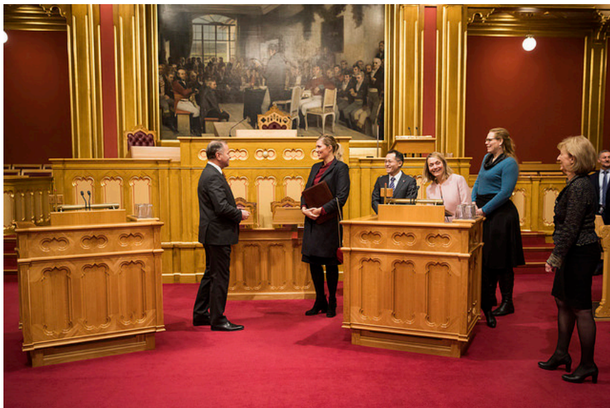
ICANs internasjonale styringsgruppe på Stortinget.

FNs atomvåpenforbud får stadig sterkere oppslutning, og vi håper at også norske politikere snart blir del av denne utviklingen. Norske politikere bør lytte til flertallet i befolkningen, og til majoriteten i FN, og gjøre Norge til en del av atomvåpenforbudet.